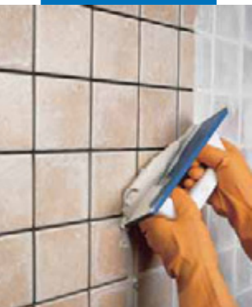
Заделка швов плитки ординарного обжига мастерком