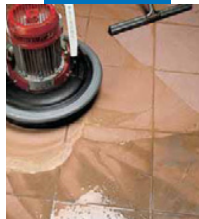
Отделка фаянсовых полов монощеткой со скребком