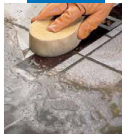
Отделка губкой керамического пола с деревянной вставкой