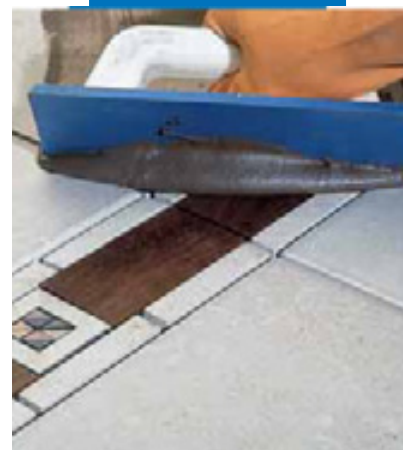
Заделка мастерком швов керамического пола с деревянной вставкой