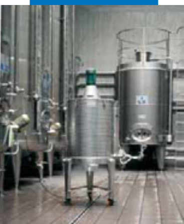
Пример заделки швов в винном производстве

Керапоху начал затвердевать следует добавить в промывочную воду 10%-ного спирта.