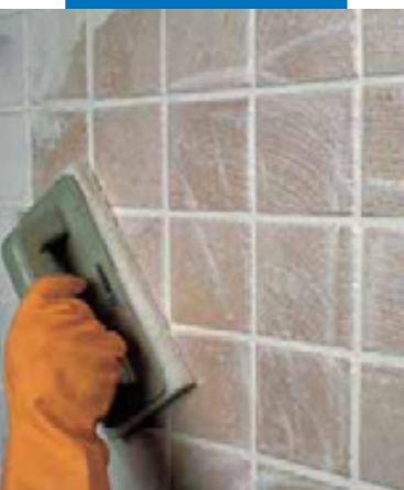
Отделка плитки ординарного обжига теркой Scotch-BriteR