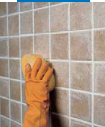
Отделка плитки ординарного обжига губкой