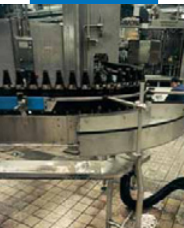
Пример заделки швов в пивном заводе