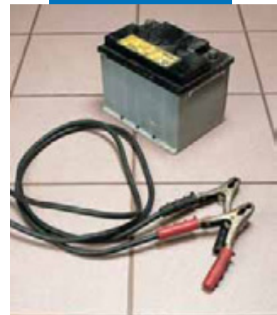
Пример заделки швов в мастерской автотехники

Избыточная влага может удаляться посредством скребка, который помогает удалять избыточную влагу с пола. Если от момента укладки прошло слишком много времени и