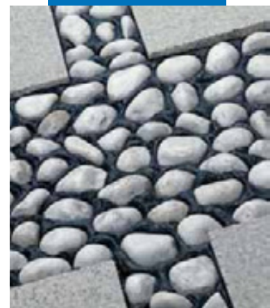
Пример заделки швов пола с каменным орнаментом