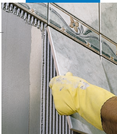
Укладка плитки ординарного обжига в качестве стенового покрытия поверх гипсовых панелей