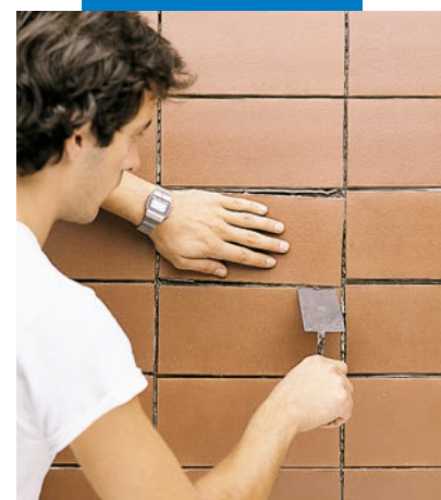
Время корректировки плитки – до 60 минут