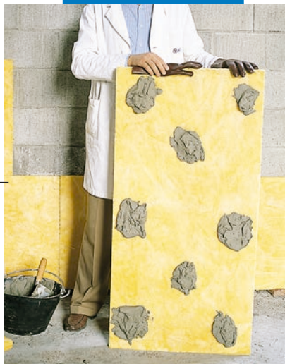
Клеевое крепление изоляционных панелей на неотделанную стену