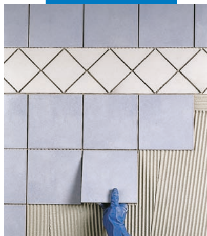
Укладка плитки ординарного обжига в качестве стенового покрытия в ванной поверх штукатурки