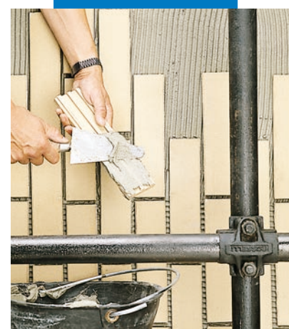
Укладка обшивки снаружи Прим.: Хорошо заполнять клеем заднюю поверхность обшивки